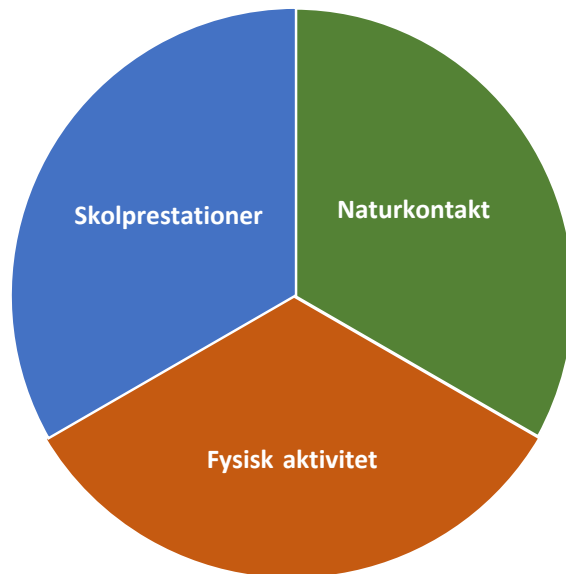
Figur 1. Litteraturgenomgången resulterade i att forskningsmaterialet kunde sorteras i tre huvudkategorier. I kunskapsöversikten redogörs för kunskapsläget utifrån var och en av dessa kategorier, det vill säga utomhusundervisningens effekter på skolprestation, fysisk aktivitet respektive naturkontakt.