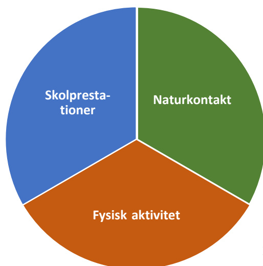
Figur 1. Forskningsmaterialet om effekter av utomhusundervisning har sorterats i tre huvudkategorier.

Litteraturgenomgången resulterade i att forskningsmaterialet kunde sorteras i tre huvudkategorier. I kunskapsöversikten redogörs för kunskapsläget utifrån var och en av dessa kategorier, nämligen utomhusundervisningens effekter på skolprestation, fysisk aktivitet och naturkontakt.